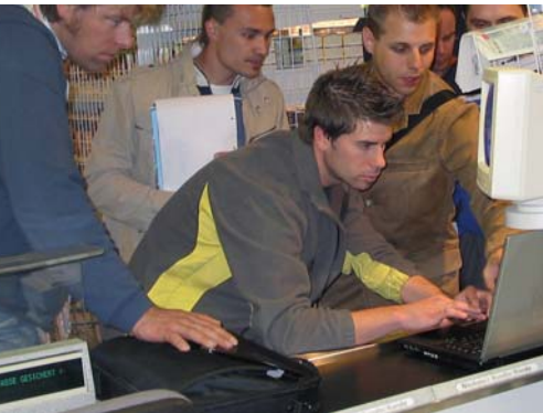
Projekt Coop: WLAN- und UKV Installationen in 950 Verkaufsstellen