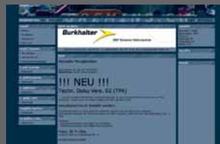
Die Startseite der Website