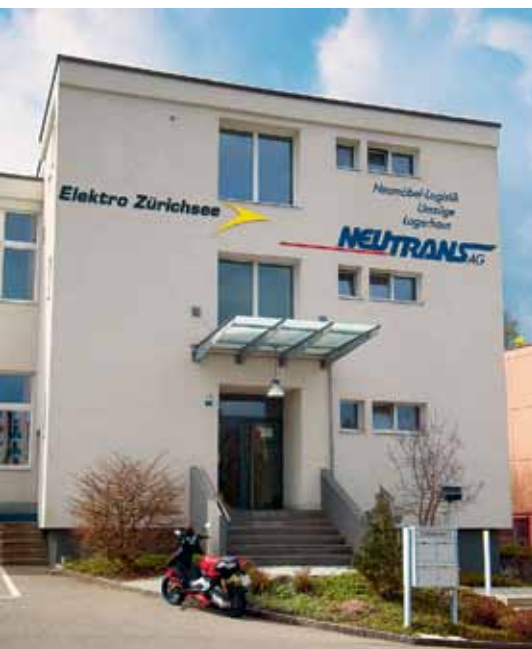
Firmengebäude Elektro Zürichsee

Ursprünglich wollte ich meine Nachfolge erst in ca. fünf Jahre regeln. Die Burkhalter Gruppe hat mir die Möglichkeit geboten, dies jetzt schon zu tun und ich kann «mein» Unternehmen weiterführen und ausbauen. Das ist doch toll !!!