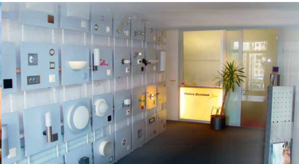
Ausstellungsraum Elektro Zürichsee